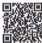
参加申し込み用 二次元コード