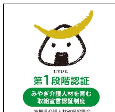
<第1段階認証マーク>

○問い合わせ先 NPO法人介護・福祉サービス非営利団体ネットワークみやぎ (みやぎ介護人材を育む取組宣言認証制度事務局) ☎022(343)8565