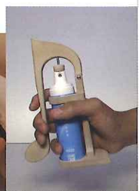
写真は、福祉機器コンテスト 2015 入賞作品