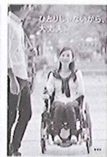
ひとりじゃないから、大丈夫 (書籍)

【交通・アクセス】 ※駐車場の台数に限りがありますので、できるかぎり公共の交通機関でお越しください。