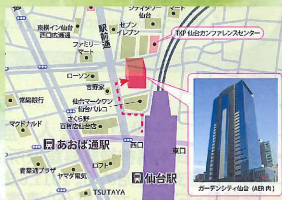
ガーデンシティ仙台 (AER内)

TKPガーデンシティ仙台 ホールC 仙台市青葉区中央1-3-1 (仙台AER 30階)