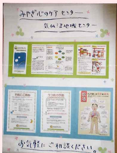
展示例 (模造紙 1 枚分)