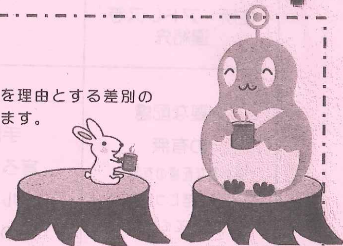
仙台市障害理解促進 キャラクター「ココロン」

条例の検討状況について報告し、少人数のグループに分かれて話し合いをおこないます。