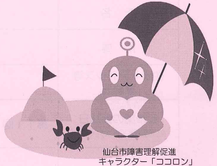
仙台市障害理解促進 キャラクター「ココロン」